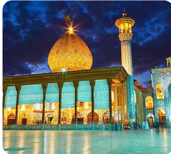
زهرا پورعابد ایبانه نویسنده